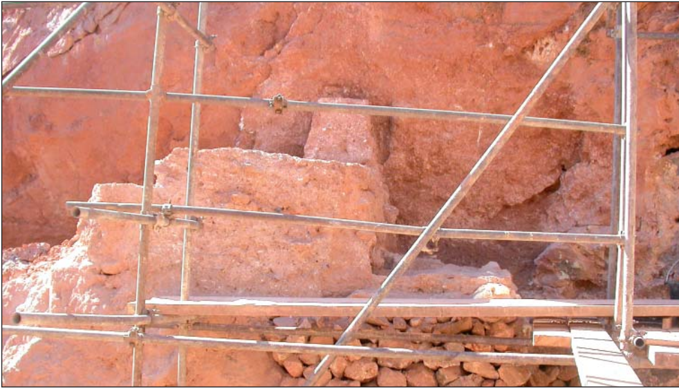
Figure 1: Site de Jbel Irhoud