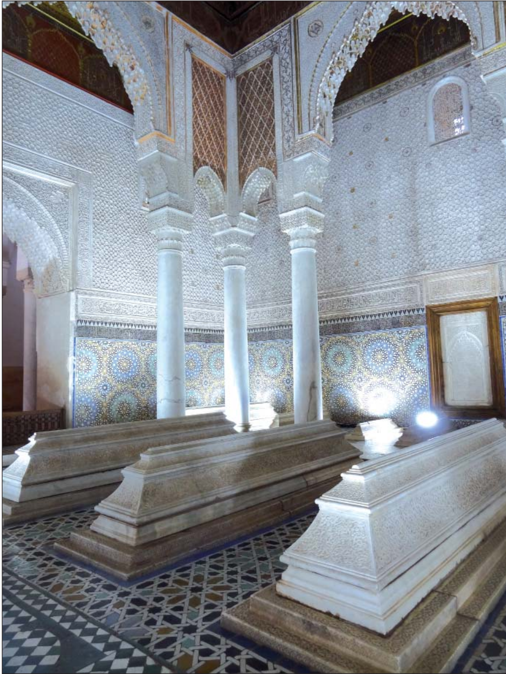
الصورة 3: قاعة الاثنا عشر عمودا بمقبرة السعديين من زاوية مختلفة