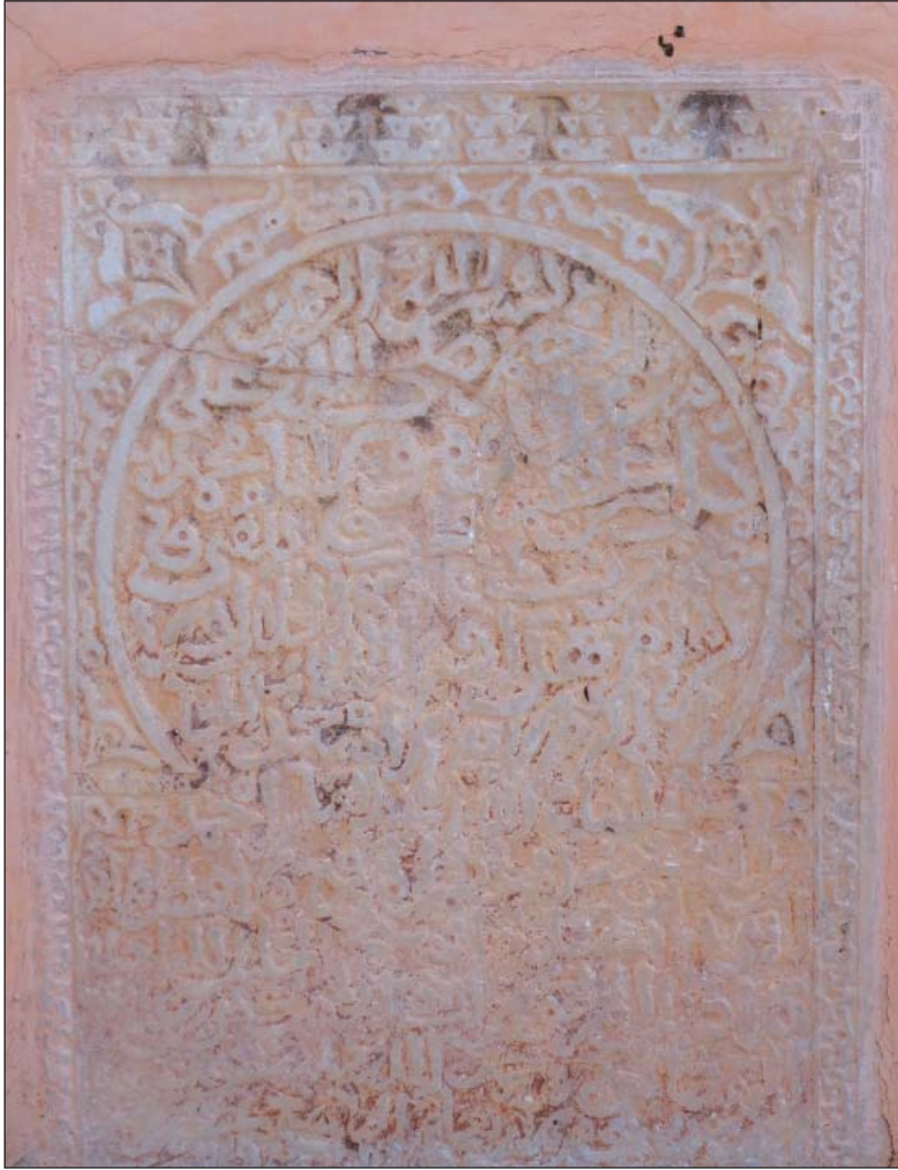
الصورة 1: شاهد قبر الأمير أحمد الهنتاتي

توفي هذا الأمير الهنتاتي حسب الكتابة العربية المنقوشة على شاهد قبره سنة 859هـ/1455م، ويتضح من خلال الكتابة حسب بيير دوسينيڤال، أنه حمل لقب الأمير في حين اقتصر والده على لقب الشيخ، وهو مؤشر اعتمده هذا الباحث إلى جانب رمزية الدفن في المقبرة المتاخمة لجامع المنصور بالقصبة، للقول بأن أحمد الهنتاتي كان أول فرد من أفراد الأسرة الهنتاتية يعلن استقلاله عن السلطة المركزية المرينية في عهد آخر سلطان مريني وهو عبد الحق (842-69هـ/1421-65م). 32