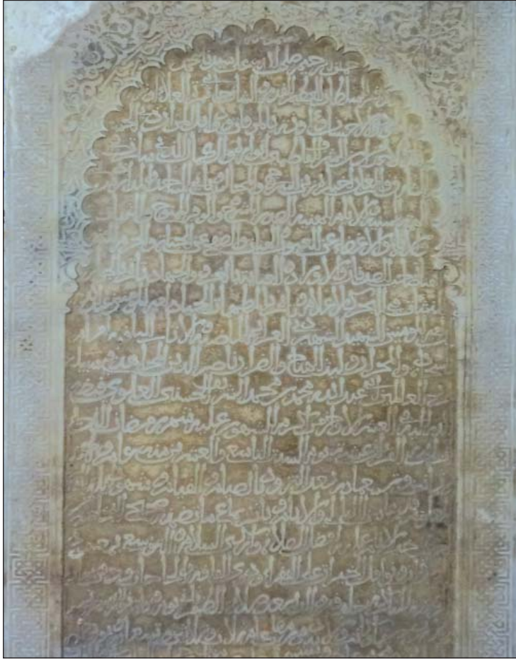
الصورة 4: اللوحة الرخامية التذكارية الخاصة بالسلطان عبد الله الغالب بالله

ومن المثير للانتباه، أن نص الكتابة المنقوشة على هذه اللوحة التذكارية، قام بكتابته رئيس الكُتَّاب أو وزير القلم الأعلى أبو فارس عبد العزيز بن محمد الفشتالي، الذي سبق وذكرنا أنه تولى إنشاء نص الكتابة المنقوشة على اللوحة الرخامية التذكارية الخاصة بمحمد الشيخ، وكذا نظم الأبيات الشعرية المنقوشة على شاهد قبره، وهو ما يؤكد الدور الكبير الذي اضطلع به الفشتالي في كتابة نصوص بعض شواهد القبور إثر وفاة أصحابها من السلاطين، ومَرَدُّ ذلك تميزه في صناعة الإنشاء، وتقديمه على غيره في تجبير الرسائل إلى الملوك والعلماء. 79