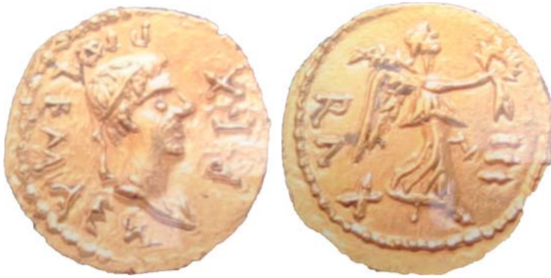
Figure 2: Photos de la pièce de monnaie découverte au site de Khemis as-Saḡel